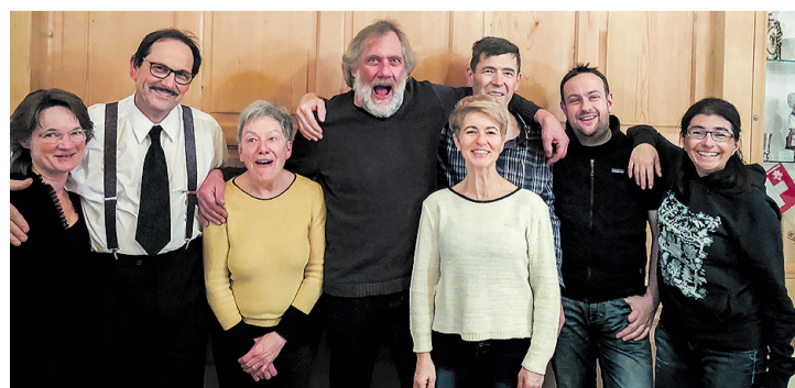
Die Schauspieler nach getaner Arbeit. Sie können auf eine erfolgreiche Premiere zurückblicken.

Video Sehen Sie online das Interview mit Paul Eggenschwiler.